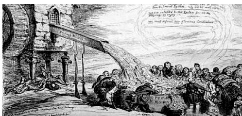
“运转得真是好”的“选举制”, 1831 年

12. [2024·湖北武汉月考] 下图是英国漫画家乔治发表的作品。漫画的左方是一处磨坊, 砖块上罗列着自治市镇的名字, 下面尸横遍野; 漫画的右下方是一群议员, 他们围绕在一个盛满了金钱的钱仓前, 从贴有“公款”标签的钱仓里取钱。据此可知, 作者意在 ( )